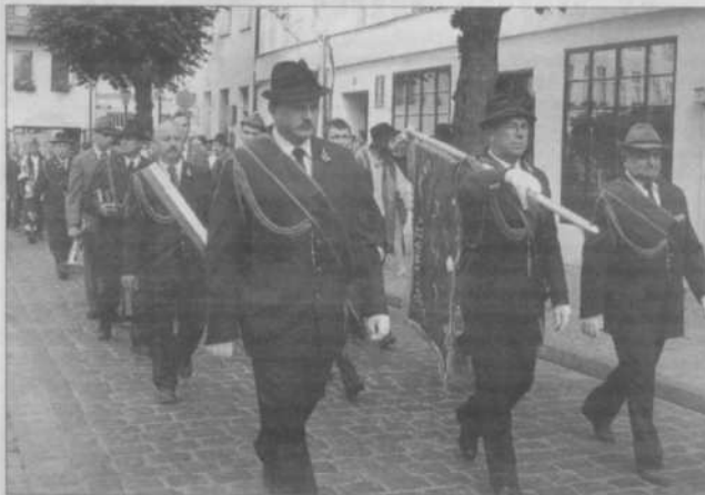
Parada ulicami Polczyna

POŁCZYN ZDRÓJ. W Polczynie Zdroju gościło ponad 500 myśliwych z całego kraju, by wspólnie uczcić 80-lecie Polskiego Związku Łowieckiego. Przez trzy dni w parku rozbrzmiewały sygnały myśliwskie, pieśni łowieckie, a wieczorami w powietrzu roznosił się zapach pieczonej dziczyzny.