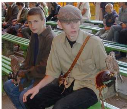
BYŁY TEŻ W POŁCZYNI PRAWDZIWE SOKOŁY Z GNIAZDA W WARCINIE