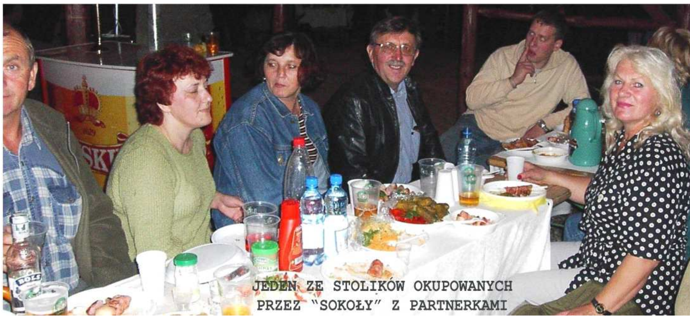
JEDEN ZE STOLIKÓW OKUPOWANYCH PRZEZ "SOKOŁY" Z PARTNERKAMI