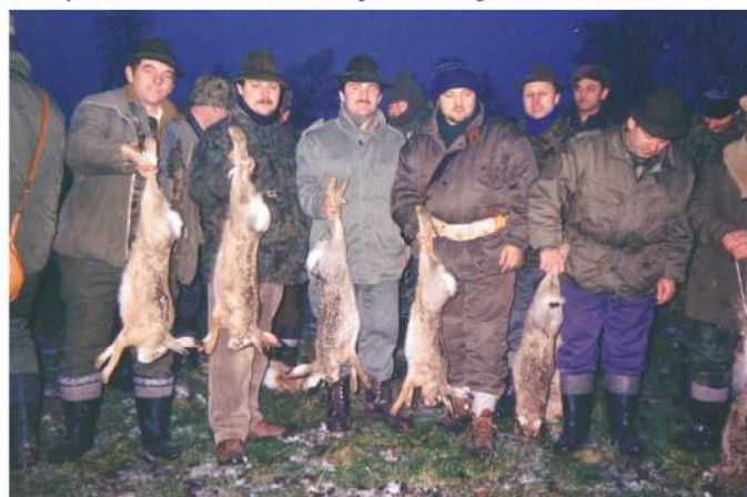
Z HISTORII SOKOŁA - SCENKI Z ZAJĘCZYCH POŁOWAŃ W KÓRNIKU PRZED 10 LATY

Miło nam poinformować, że w wydany przez Lasy Państwowe albumie "ARCHITEKTURA SADYB LEŚNYCH" znalazła się też nasza "SOKOŁÓWKA".