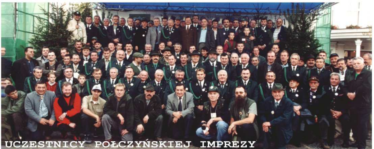
UCZESTNICY POŁCZYŃSKIEJ IMPREZY